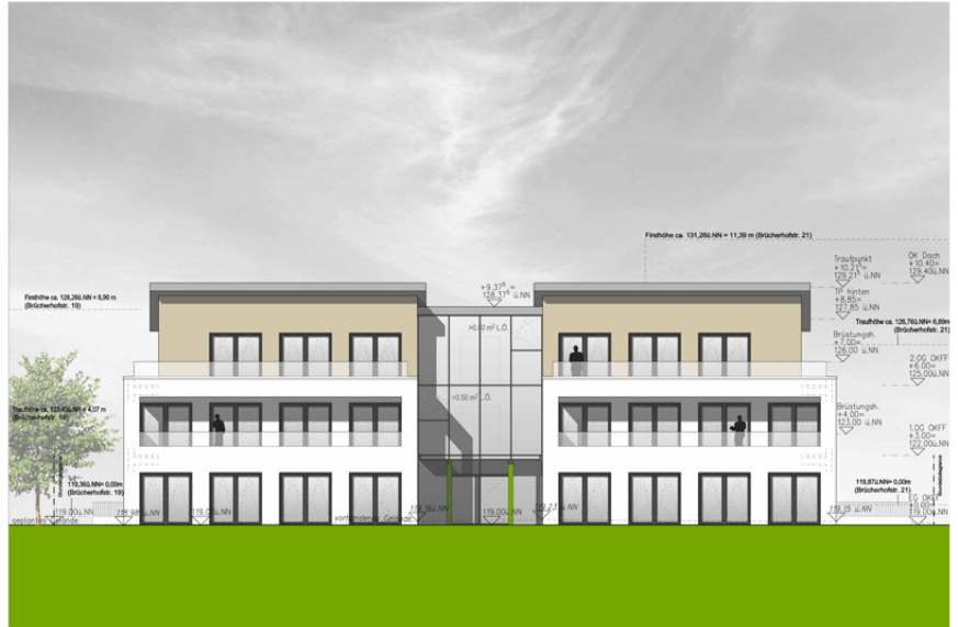
Ansicht von Westen