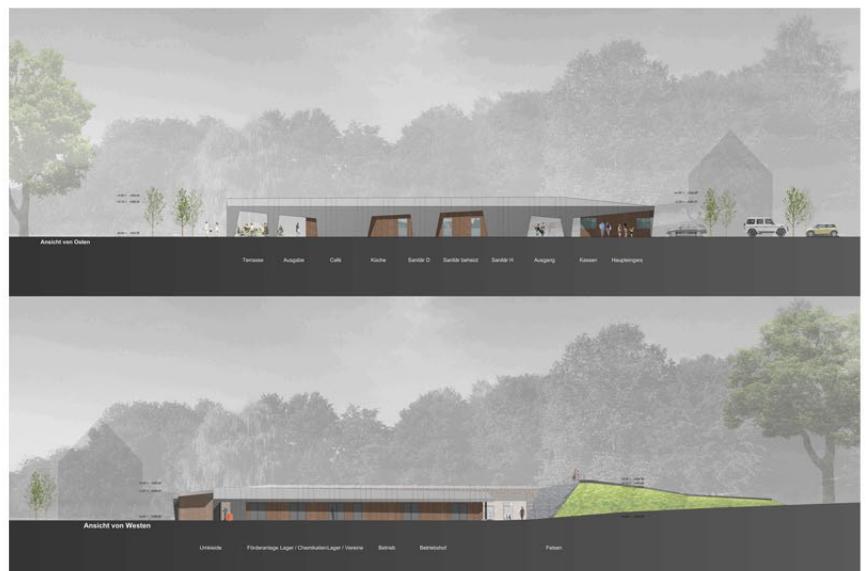
Ansichten Ost u. West

Das Thema Nachhaltigkeit findet sich u.a. in den verwendeten Baumaterialien aus der Umgebung und nachwachsenden Rohstoffen und der modernen ressourcensparenden Bädertechnik, wie Solarthermie oder Biomasseheizung wieder. Auch die geplanten Offenlegungen der Bachläufe, einschließlich deren Renaturierung, stellen einen positiven Beitrag für den Erhalt der Umwelt dar.