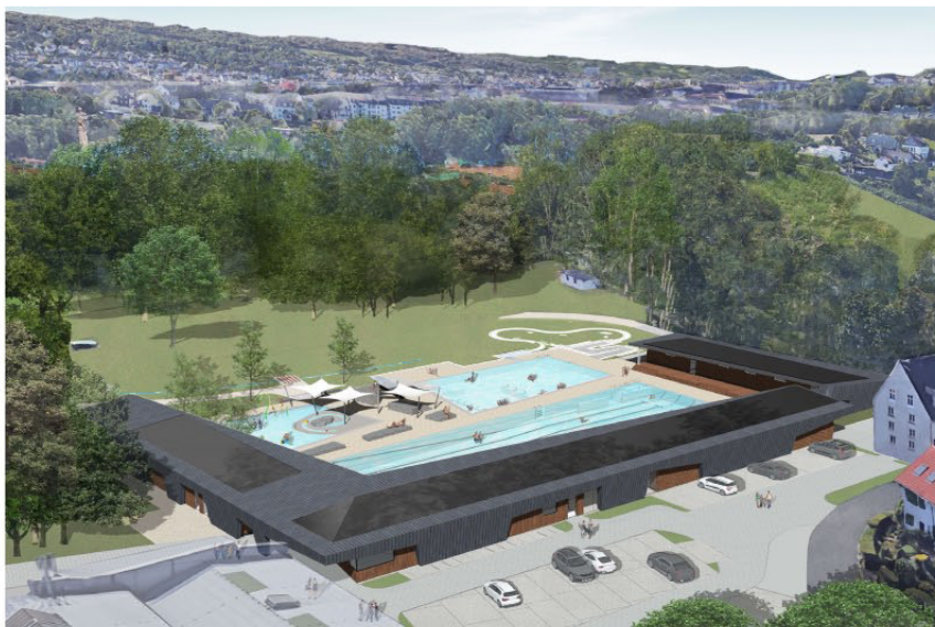
Vogelperspektive von Nordosten