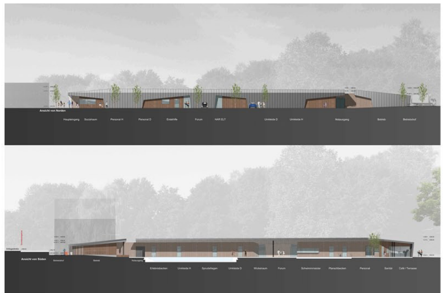
Ansichten Nord u. Süd

Das Thema Nachhaltigkeit findet sich u.a. in den verwendeten Baumaterialien aus der Umgebung und nachwachsenden Rohstoffen und der modernen ressourcensparenden Bädertechnik, wie Solarthermie oder Biomasseheizung wieder. Auch die geplanten Offenlegungen der Bachläufe, einschließlich deren Renaturierung, stellen einen positiven Beitrag für den Erhalt der Umwelt dar.