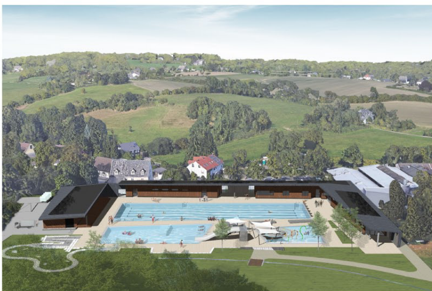
Vogelperspektive von Süden